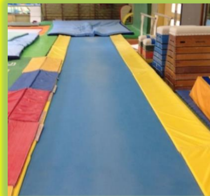
タンブリングトランポリン