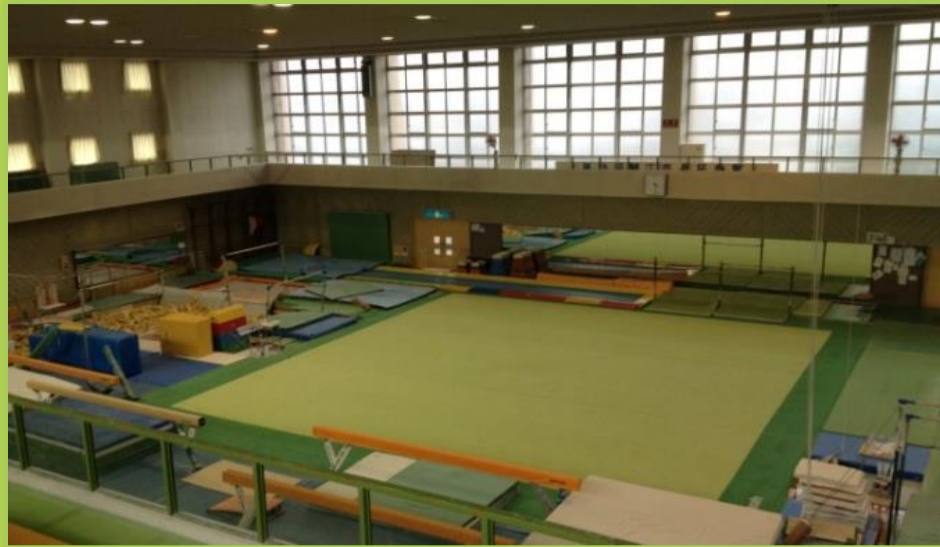
体育館の全体の様子