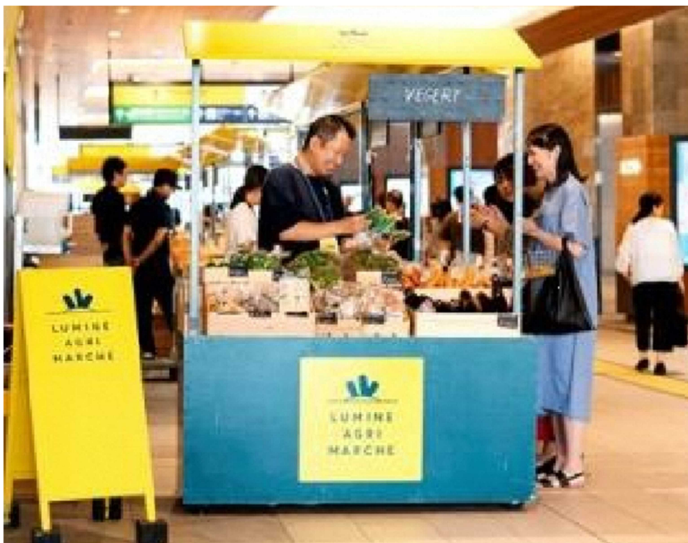
(マルシェのイメージ)