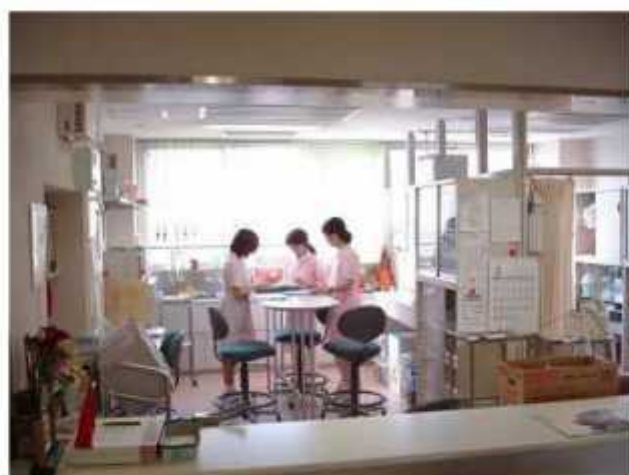
ナース ステーション