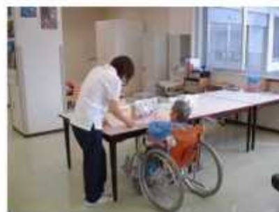
パズルによるリハビリ