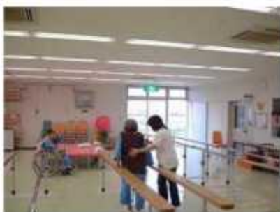
リハビリ室での歩行訓練